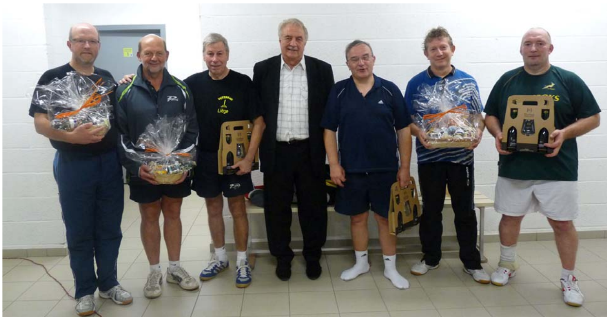
Les podiums B & C0-C2 du Critérium National Vétérans