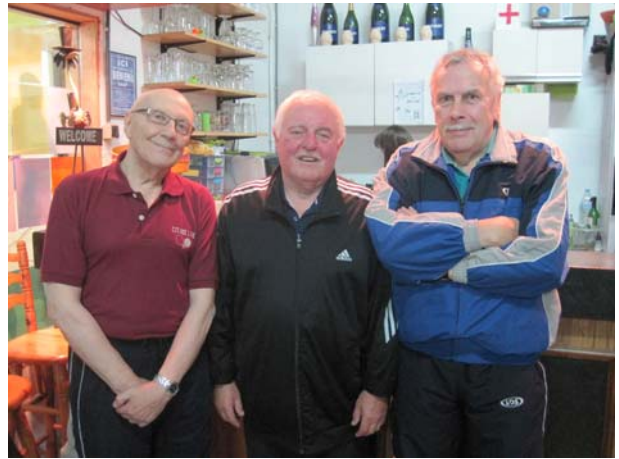
Les lauréats du Challenge Hutois