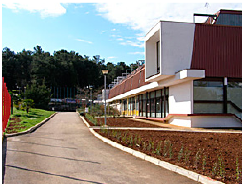
Sport hall „Veli Jože“ Porec